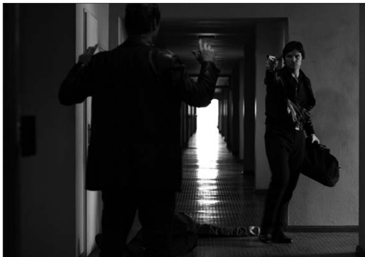
Reinhold Vorschneider © Schramm Film

vendredi 1 er octobre à 20 h et samedi 2 octobre à 16 h